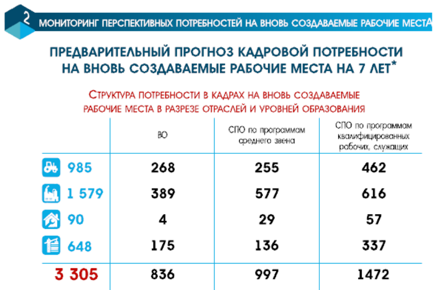
Рисунок 2—Прогноз кадровой потребности Ярославской области

3305 человек, из них на долю промышленности приходится 1579 мест. Из них потребность в выпускниках среднего профобразования составляет по программам среднего звена 577 человек, квалифицированных рабочих, служащих - 616 человек.