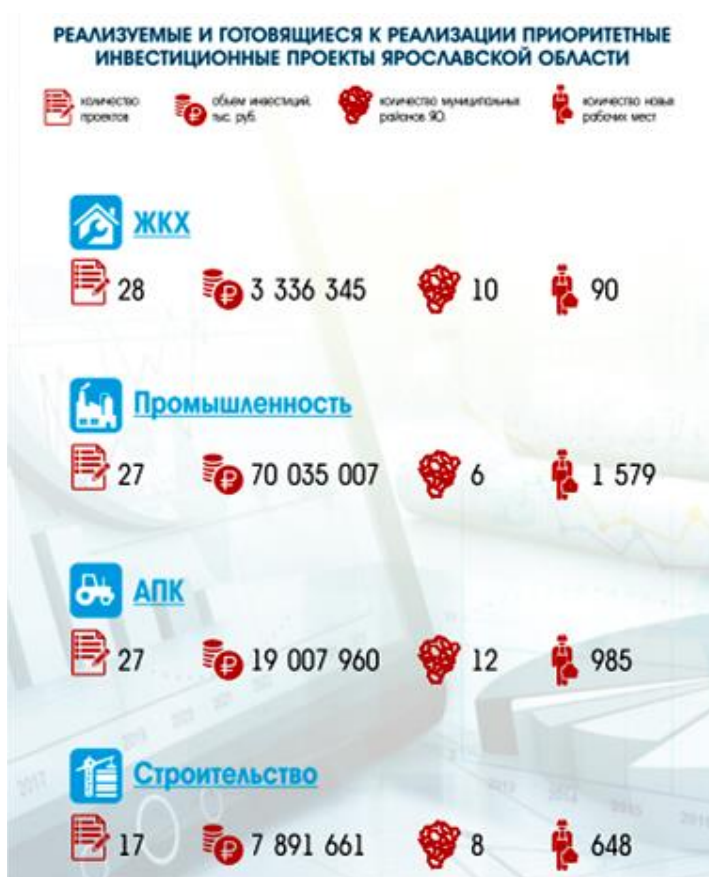
Рисунок 1 – Приоритетные инвестиционные проекты Ярославской области

В текущей экономической ситуации в регионе уделяется особое внимание поддержке промышленности и бизнеса. В целях оказания финансовой помощи предприятиям докапитализированы фонды регионального развития и поддержки предпринимательства Ярославской области. В Ярославской области в настоящее время при сопровождении инвестиционного блока регионального правительства реализуется более 70 инвестиционных проектов. Общий объем инвестиций в эти проекты составляет более 17 млрд. руб.