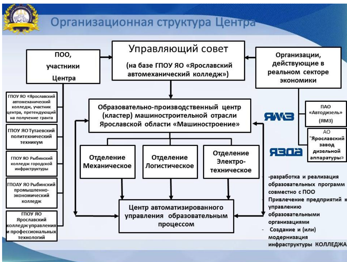
Рисунок 4 - Структура управления Центром

Текущее руководство и координация деятельности участников Центра возлагается на Управляющий совет (коллегиальный орган управления образовательной организацией, являющейся участником Центра, претендующим на получение гранта, в состав которого включены представители всех участников Центра).